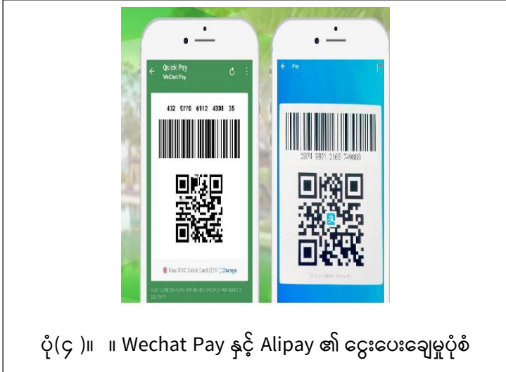
ပုံ(၄)။ ။ Wechat Pay နှင့် Alipay ၏ ငွေပေးချေမှုပုံစံ