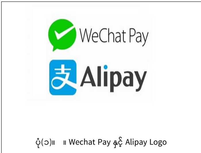
ပုံ(၁)။ ။ Wechat Pay နှင့် Alipay Logo

ထိုကဲ့သို့ငွေပေးချေမှုများကြောင့် မြန်မာနိုင်ငံသည် ဝင်ငွေမည်မျှရရှိနိုင်ကြောင်း၊ မည်မျှ ဆုံးရှုံးနေကြောင်းကို အချက်အလက်များ တိတိကျကျမရရှိသေးပါ။