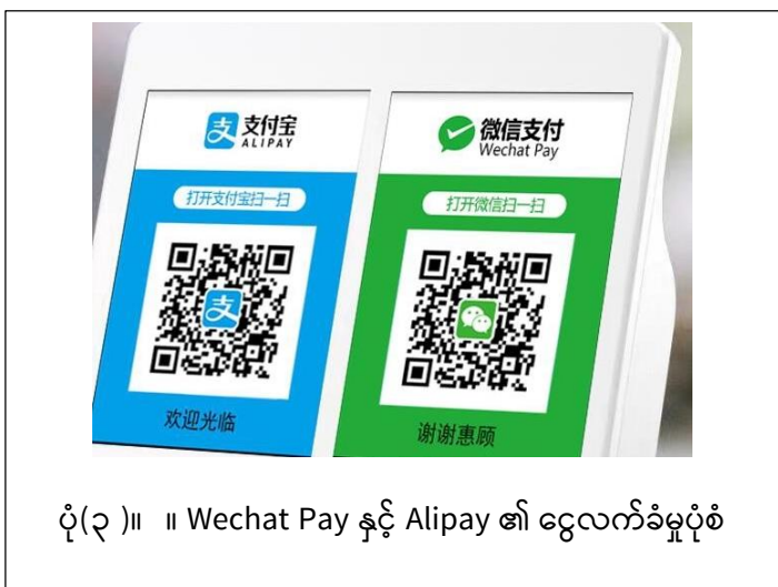
ပုံ(၃)။ ။ Wechat Pay နှင့် Alipay ၏ ငွေလက်ခံမှုပုံစံ