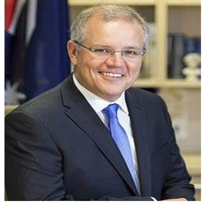
ဝန်ကြီးချုပ် Scott Morrison

၅။ ဖက်ဒရယ်အစိုးရအား အောက်ပါအတိုင်းကဏ္ဍ (၃) ခုခွဲခြားသတ်မှတ်နိုင်သည်-