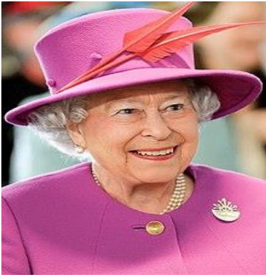
ဘုရင်မ Elizabeth II