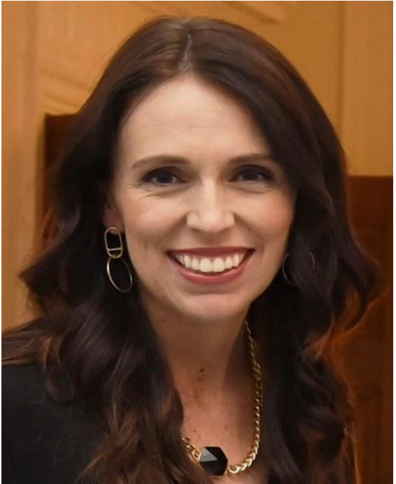
ဘုရင်ခံချုပ် Dame Patsy Reddy