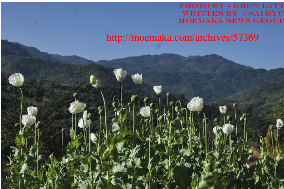
WRITTEN BY - SAI BYU MOEMAKA NEWS GROUP http://moemaka.com/archives/57369

၂။ မြန်မာနိုင်ငံသည် ကမ္ဘာတွင် ဘိန်းထုတ်လုပ် မှု ဒုတိယအမြင့်ဆုံးနိုင်ငံဖြစ်ပြီး၊ ကမ္ဘာထုတ်လုပ်မှု ၏ ၈ ရာခိုင်နှုန်းမှာ မြန်မာနိုင်ငံမှဖြစ်သည့်အပြင် အမ်ဖက်တမ်းစိတ်ကြွဆေးပြားအပါအဝင် မူးယစ် ဆေးဝါးအဓိကမြစ်ဖျားခံရာဒေသဟု သတ်မှတ်ပြော