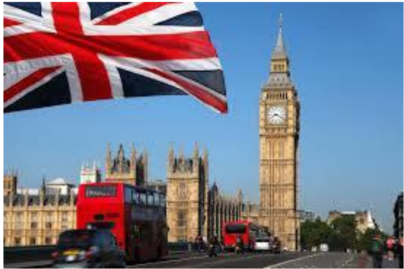
ပါလီမန်ရုံးစိုက်ရာ ဝက်စ်မင်စတာနန်းတော်

၁၇။ အောက်လွှတ်တော်သည် အစိုးရအားအယုံအကြည်မရှိကြောင်း အဆိုတင်သွင်းနိုင်ကာ အယုံအကြည်မရှိ အဆိုတင်သွင်းခြင်းခံရသည့် အစိုးရအဖွဲ့ဝန်ကြီးချုပ်သည် မဖြစ်မနေ နှုတ်ထွက်ရသည့်အခြေအနေသို့ ရောက်ရှိမည်ဖြစ်သည်။ ထိုအခြေအနေမျိုးတွင် လွှတ်တော်က အဆိုပြုသည့် အမတ်တစ်ဦးကို ခန့်ထားခြင်းသော်လည်းကောင်း၊ ဘုရင်ထံလျှောက်ထား၍ လွှတ်တော်ကို ဖျက်သိမ်းကာ အထွေထွေရွေးကောက်ပွဲပြန်လည်ကျင်းပခြင်းကိုသော်လည်းကောင်း ဆောင်ရွက်နိုင်သည်။