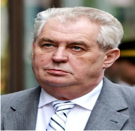
သမ္မတ Miloš Zeman