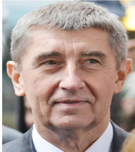
ဝန်ကြီးချုပ် Andrej Babiš

၆။ ချက်သမ္မတနိုင်ငံ၏လွှတ်တော်များသည် ဥပဒေများပြင်ဆင်၊ ဖျက်သိမ်း၊ အတည်ပြုခြင်း ကိစ္စရပ်များနှင့်နိုင်ငံတကာစာချုပ်စာတမ်းများချုပ်ဆိုခြင်း၊ သဘောတူညီမှုရယူခြင်းကိစ္စရပ်များ ကို အတည်ပြုခြင်းစသည့် လုပ်ငန်းများကိုအဓိကထားဆောင်ရွက်သည်။ အဆိုပါကိစ္စရပ်များ ဆောင်ရွက်ရန်အတွက် အထက်လွှတ်တော်နှင့် အောက်လွှတ်တော်(၂)ရပ်ပေါင်း ကိုယ်စားလှယ် ၆၀ ရာခိုင်နှုန်း၏ သဘောတူညီချက်ရရှိရန်လိုအပ်သည်။