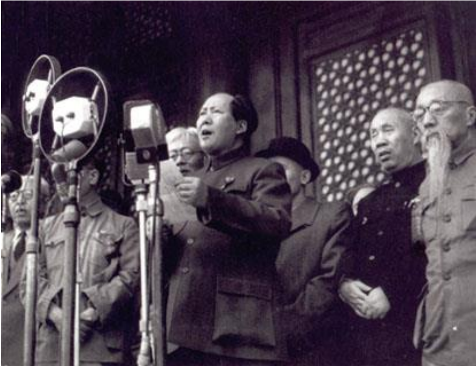
မော်စီတုံးမှတရုတ်ပြည်သူ့သမ္မတနိုင်ငံတည်ထောင်ကြောင်းကြေညာစဉ်

၅။ ၁၉၄၅ ခုနှစ်တွင် ဂျပန်တို့လက်နက်ချပြီးနောက်ပိုင်း ကူမင်တန်နှင့်ကွန်မြူနစ်တို့၏ ပဋိပက္ခပြန်လည်စတင်လာခဲ့ပြီးနောက် မော်စီတုံးဦးဆောင်သည့် တရုတ်ကွန်မြူနစ်ပါတီ၏ ပြည်သူ့လွတ်မြောက်ရေးတပ်မတော်သည် တရုတ်ပြည်မကြီးအားထိန်းချုပ်နိုင်ခဲ့ပြီး ကူမင်တန်တို့သည် ထိုင်ဝမ်ကျွန်းသို့ဆုတ်ခွာခဲ့ရသည်။ ၁၉၄၉ ခုနှစ်၊ အောက်တိုဘာလ ၁ ရက်နေ့တွင် ကွန်မြူနစ်ပါတီခေါင်းဆောင်မော်စီတုံးသည် တရုတ်ပြည်သူ့သမ္မတနိုင်ငံတည်ထောင်ကြောင်း ကြေညာခဲ့သည်။