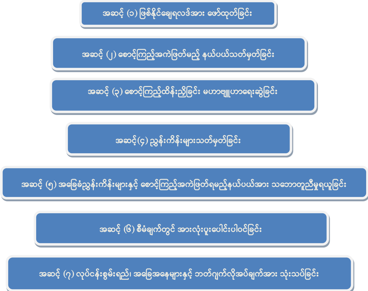
ပုံ(၂)စောင့်ကြည့်အကဲဖြတ်ခြင်းမူဘောင်အဆင့်များ

ပါဝင်နိုင်ပါသည်။ စောင့်ကြည့်အကဲဖြတ်ခြင်းလုပ်ငန်းစဉ်မူဘောင်ရေးဆွဲရာ၌ ပဋိပက္ခတွင် ပါဝင်သည့်လူပုဂ္ဂိုလ်/ အဖွဲ့အစည်းများ၏ ဓလေ့အမူအကျင့်များကို ထည့်သွင်းစဉ်းစားရန် လိုအပ်သည်။ အဆိုပါအချက်သည် စောင့်ကြည့်အကဲဖြတ်မှုလုပ်ငန်းစဉ်၏ ပွင့်လင်းမြင်သာမှုနှင့် စောင့်ကြည့်အကဲဖြတ်ခံအုပ်စုများအပေါ် အကျိုးသက်ရောက်မှုများပြားပါသည်။ စောင့်ကြည့်ခြင်းဆိုသည်မှာ လုပ်ငန်းစဉ်တစ်လျှောက်လုံးအား စဉ်ဆက်မပြတ်စောင့်ကြည့်ခြင်းဖြစ်ပြီး အကဲဖြတ်ခြင်းသည် လုပ်ငန်းစဉ်၏ ရလဒ်အပေါ်သုံးသပ်ခြင်းဖြစ်သည်။ စောင့်ကြည့်အကဲဖြတ်ခြင်းမူဘောင်ရေးဆွဲရာတွင် အောက်ပါပုံ(၂) အတိုင်း အဆင့်(၇)ဆင့်ဖြင့်ဆောင်ရွက်နိုင်ပါသည်။ ၁၃