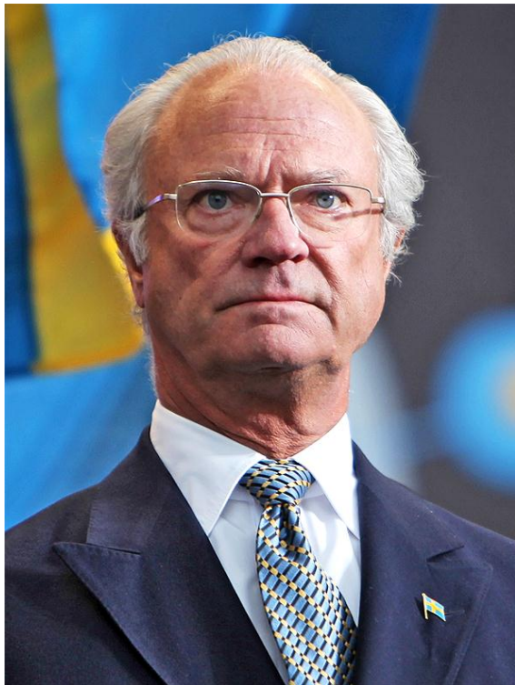
ဆွီဒင်ဘုရင် Carl XVI Gustaf

၇။ ဆွီဒင်နိုင်ငံသည် စည်းမျဉ်းခံဘုရင်စနစ် ကျင့်သုံးသောနိုင်ငံဖြစ်၍ ဘုရင်သည် နိုင်ငံတော်၏အကြီးအကဲဖြစ်ပြီး ဝန်ကြီးချုပ်သည် အစိုးရအဖွဲ့အကြီးအကဲဖြစ်သည်။ ဆွီဒင်အစိုးရ(Regeringen)သည် အုပ်ချုပ်ရေးအာဏာရှိသည်။ လက်ရှိဘုရင်မှာ Carl XVI Gustaf ဖြစ်ပြီး ၁၉၇၃ ခုနှစ်၊ စက်တင်ဘာလ ၁၉ ရက်နေ့တွင် နန်းတက်ခဲ့သည်။ ဝန်ကြီးချုပ်မှာ Stefan Lofven ဖြစ်ပြီး ၂၀၁၄ခုနှစ်၊ အောက်တိုဘာလ ၃ ရက်နေ့မှ ယခုအချိန်အထိတာဝန်ထမ်းဆောင်ဆဲ ဖြစ်သည်။ ဆွီဒင်နိုင်ငံ၏ ထူးခြားချက်မှာ ဘုရင်သည် နိုင်ငံတော်၏အကြီးအကဲဖြစ်သော်လည်း အခမ်းအနားများ တက်ရောက်ခြင်း နှင့် ဂုဏ်ထူးဆောင် ပုဂ္ဂိုလ်တစ်ဦးအဖြစ်သာ သတ်မှတ်ထားပြီး လိုအပ်ပါက လွှတ်တော်အနေဖြင့် မင်းမျိုးမဟုတ်သော ပြင်ပ ပုဂ္ဂိုလ်တစ်ဦးအား ဘုရင်အဖြစ်တင်မြှောက်နိုင်သည်။ သာဓကအနေဖြင့် ၁၈၀၀ ပြည့်နှစ်တွင်သားသမီးမရှိသောဘုရင် Charles XIII ကွယ်လွန်ချိန်တွင် ပြင်သစ်ဗိုလ်ချုပ်ကြီးဟောင်းဖြစ်သူ Jean Bernadotte အားအိမ်ရှေ့မင်းသားအဖြစ်တင်မြှောက်ခဲ့ပြီး နောက်ပိုင်းတွင် Charles XIV John of Sweden အဖြစ်နန်းတက်ခဲ့သည်။