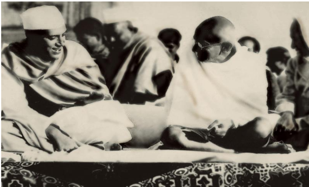
မဟတ္တမဂန္ဒီ(လက်ယာဘက်)နှင့် ဂျဝါဟလာ နေရူး(၁၉၃၇)၊ နေရူးသည် ၁၉၄၇တွင် အိန္ဒိယ၏ ပထမဆုံးဝန်ကြီးချုပ်ဖြစ်လာခဲ့သည်။

၆။ ၂၀ ရာစု၏ ပထမပိုင်းရာစုနှစ်တစ်ဝက်တွင် အိန္ဒိယအမျိုးသားကွန်ဂရက်နှင့် အခြား နိုင်ငံရေးအဖွဲ့အစည်းများမှ တစ်နိုင်ငံလုံးအတိုင်းအတာဖြင့် လွတ်လပ်ရေးကြိုးပမ်းမှုကို စတင် ခဲ့သည်။ ၁၉၂၀ခုနှစ် နှင့် ၁၉၃၀ခုနှစ်တို့တွင် မဟတ္တမဂန္ဒီ၏ဦးဆောင်မှုဖြင့် အဟိံသခေါ် အကြမ်းမဖက်ရေး လမ်းစဉ်အောက်တွင် သန်းပေါင်းများစွာသော ဆန္ဒပြသူတို့သည် တစ်စုတစ်ဝေး တည်းသော အာဏာဖီဆန်ရေးလှုပ်ရှားမှုများတွင် ပါဝင်ခဲ့ကြသည်။ နောက်ဆုံး၌ ၁၉၄၇ ခုနှစ် ဩဂုတ်လ၁၅ရက်နေ့တွင် အိန္ဒိယသည် ဗြိတိသျှတို့၏အုပ်ချုပ်မှုအောက်မှ လွတ်လပ်ရေးရခဲ့ သည်။ အိန္ဒိယနိုင်ငံနှင့် ပါကစ္စတန်နိုင်ငံသည် သီခြားစီလွတ်လပ်ရေးရရှိခဲ့သည်။ သို့သော် မူဆလင်အဖွဲ့တို့၏ဆန္ဒအရ ဘာသာရေးအရကွဲပြားသော အိန္ဒိယဒိုမီနီယံနှင့် ပါကစ္စတန်ဒိုမီနီယံ တို့အတွက် လွတ်လပ်သောအစိုးရအဖွဲ့များဖြင့် ခွဲခြားဖွဲ့စည်းခဲ့သည်။ အိန္ဒိယနှင့် ပါကစ္စတန် ဘာသာရေးအကွဲအပြဲကြောင့် လူသန်းပေါင်းများစွာ သေဆုံးခဲ့ကြရသည်။ ၁၉၄၇တွင် အိန္ဒိယ သည် သမ္မတနိုင်ငံဖြစ်လာခဲ့ပြီး ဖွဲ့စည်းပုံအခြေခံဥပဒေအသစ် စတင်အသက်ဝင်လာခဲ့သည်။