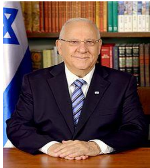
သမ္မတ ရူဘင်ရစ်ဗ်လင်

၁၁။ အစ္စရေးနိုင်ငံသည် ဒီမိုကရက်တစ်သမ္မတနိုင်ငံ ဖြစ်သည်။ ၁၈ နှစ်ပြည့်ပြီးသည့် နိုင်ငံသားများက လျှို့ဝှက်ဆန္ဒမဲဖြင့် တင်မြောက်သော အမတ် ၁၂၀ ပါဝင်သည့် ကနက်ဆက် ခေါ်ပြည်သူ့လွှတ်တော်က ရွေးချယ်ခန့်ထားသည့် သမ္မတနှင့် သမ္မတမှရွေးချယ် ခန့်ထားသော ဝန်ကြီးချုပ်အမှူးရှိသည့် ဝန်ကြီးများပါဝင်သောအစိုးရအဖွဲ့ဖြင့် အုပ်ချုပ်သည်။ ကနက်ဆက် ပြည်သူ့လွှတ်တော်ကို လေးနှစ်တစ်ကြိမ် ရွေးကောက်ပွဲကျင်းပ၍ သမ္မတကို ငါးနှစ်တစ်ကြိမ် ရွေးချယ်တင်မြောက်ရသည်။ အစ္စရေးနိုင်ငံတွင် စာဖြင့်ရေးသားအတည်ပြုထားသော အုပ်ချုပ်မှု အခြေခံဥပဒေဟူ၍မရှိသော်လည်း လွှတ်တော်မှပြဋ္ဌာန်းသော ဥပဒေများ၊ အစိုးရအဖွဲ့မှ ချမှတ်သော စီမံကိန်းများဖြင့် အုပ်ချုပ်လျက်ရှိသည်။ လက်ရှိသမ္မတမှာ ရူဘင်ရစ်ဗ်လင် ဖြစ်ပြီး၊ ဝန်ကြီးချုပ်မှာ ဘင်ဂျမင်နေတန်ညာဟု ဖြစ်ပါသည်။