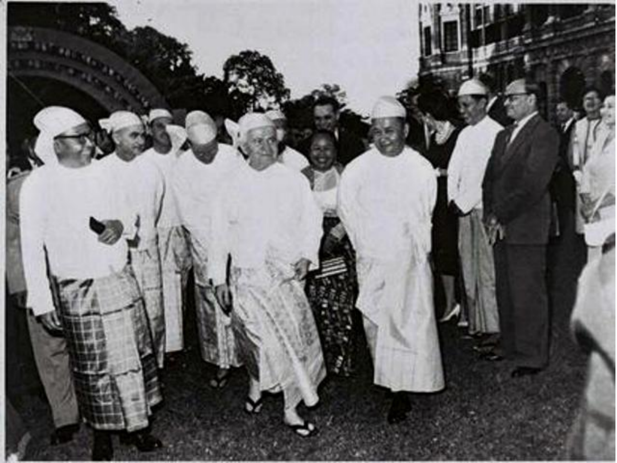
၁၉၆၁ ခုနှစ်၊ အစ္စရေးဝန်ကြီးချုပ် ဒေးဗစ်ဘင်ဂူရီယန် လာရောက်လည်ပတ်စဉ် ဝန်ကြီးချုပ်အား မြန်မာဝတ်စုံနှင့် တွေ့ရစဉ်