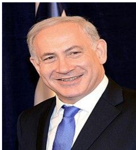
ဝန်ကြီးချုပ် ဘင်ဂျမင်နေတန်ညာဟု