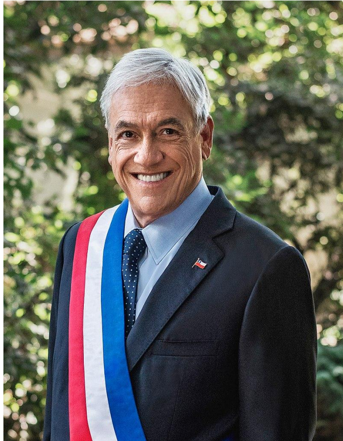
သမ္မတ Sebastián Piñera