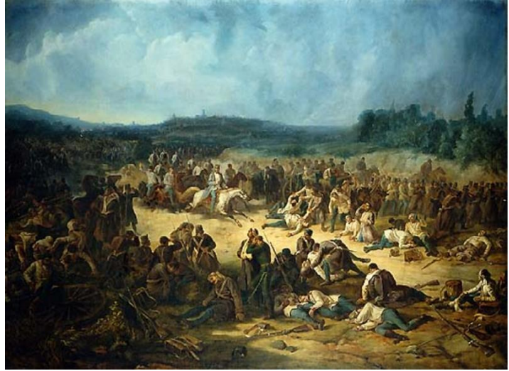
ဟင်နရီဒူးနန်